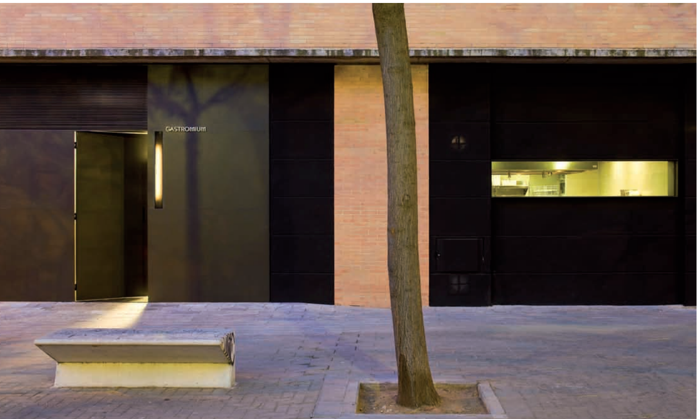
Grandes puertas correderas de chapa negra que dan entrada al restaurante. /Large black metal sliding doors that provide the entrance to the restaurant.