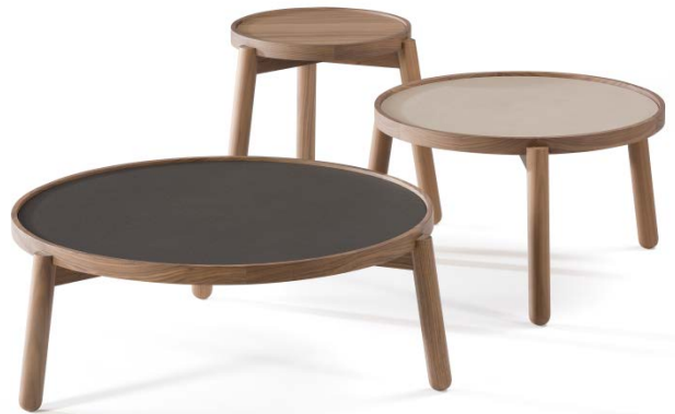
VAN coffee table collection for KENDO. 2013