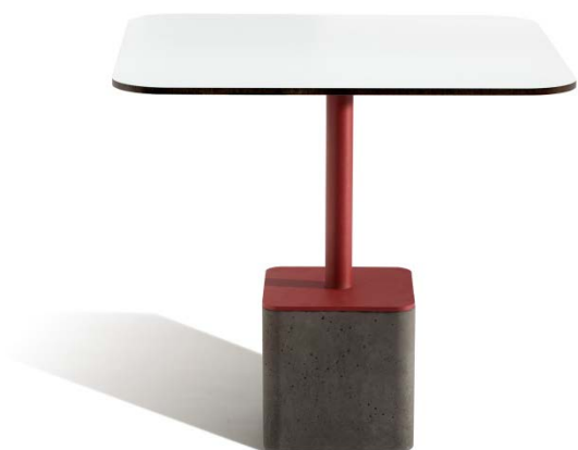
GUS table for CAPDELL. 2015

Han sido unos años de esfuerzos y merecidas recompensas y hoy podemos afirmar que has logrado abrirte un hueco muy relevante en el mundo del diseño. Además, tu trayectoria ha sido reconocida con varios premios, como los Contract World Awards, ICFE Editors Awards, Premios FAD y Premios ASCER. También has resultado finalista en los Premios Nacionales de Diseño y los Delta, entre otros. ¿Es tan difícil mantener un estilo propio, que te define como diseñador, satisfaciendo a las vez las necesidades de tus clientes?