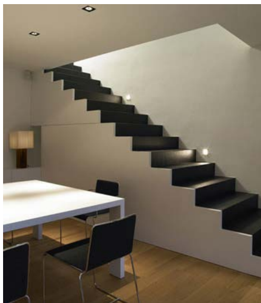
CN House. Cabrera, Spain. 2006

“Un interiorismo al servicio de la arquitectura, y una arquitectura proporcionada al interior”. Son palabras tuyas para definir uno de tus proyectos residenciales más emblemáticos, la Casa Cn. Pero ¿cómo se materializan tus proyectos y sobre todo qué es lo que te inspira? ¿Puedes definir tu estilo?