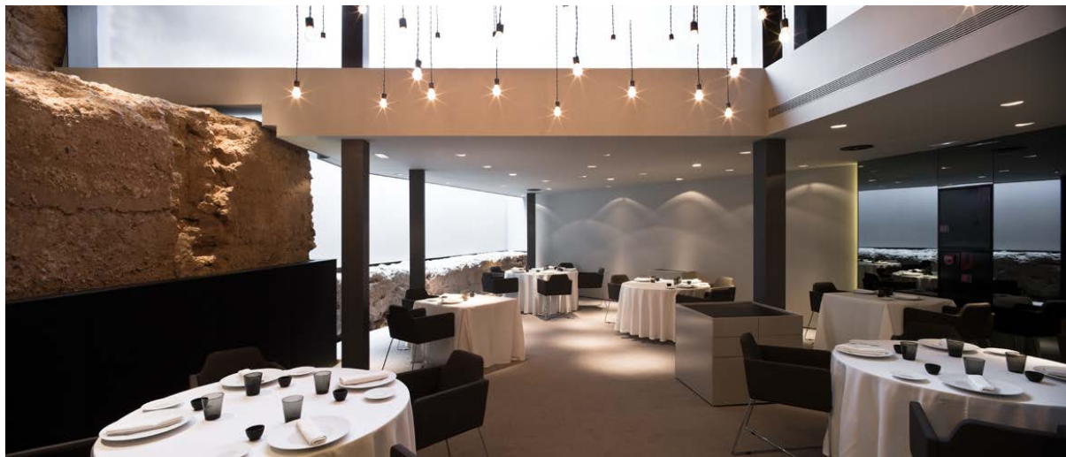
Alma del Temple Restaurant. Marques de Caro Hotel. Valencia, Spain. 2012

Has trabajado en entornos con características ambientales e históricas de gran valor (Hotel Caro, Restaurante Alma del Temple, Central Bar...). ¿Cómo te relacionas con la tradición? ¿Tratas reinterpretarla o de alguna forma te dejas contaminar por ella?