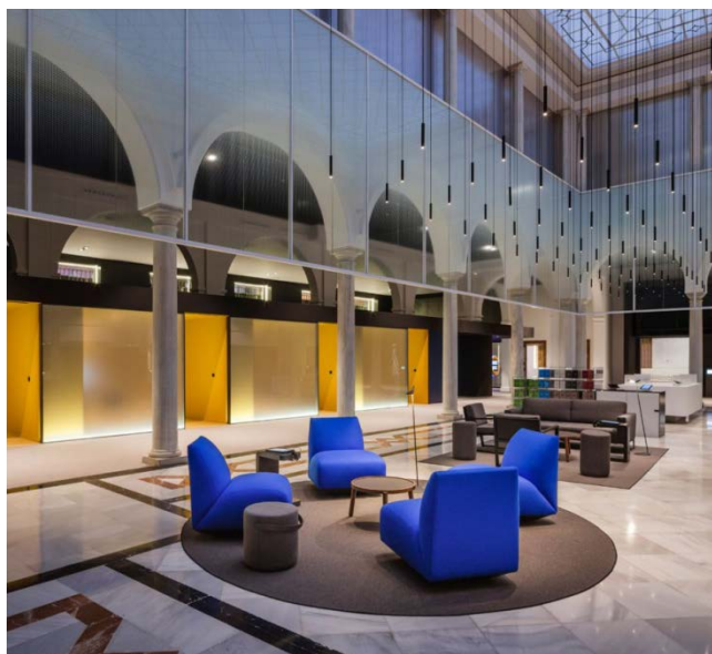
LA CAIXA Offices. Seville, Spain. 2015