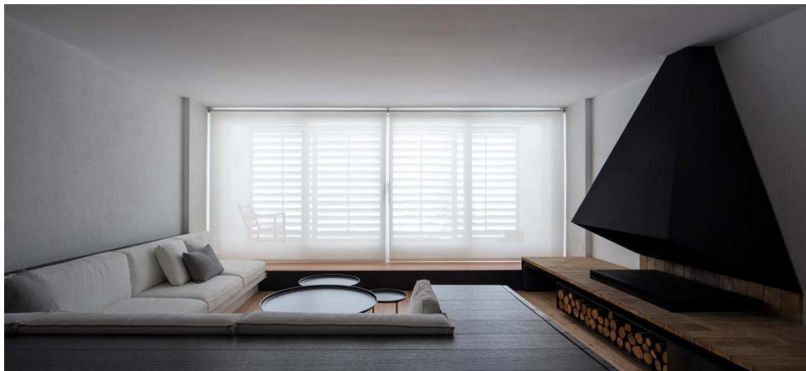
GN Apartment. Cadaqués (Girona), Spain. 2014