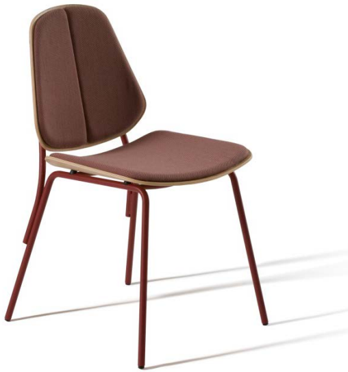
COLL chair for CAPDELL. 2015