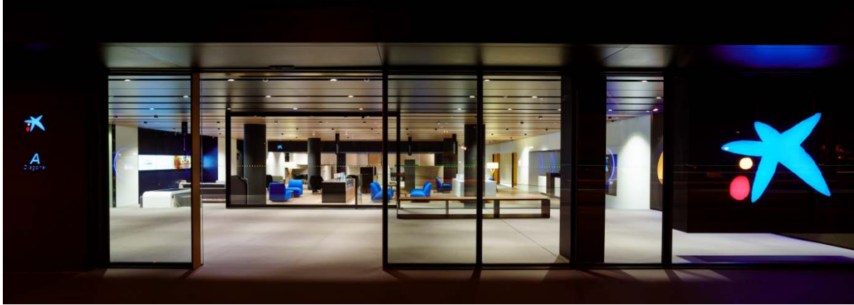
LA CAIXA Offices. Barcelona, Spain. 2014

Has trabajado en muchos proyectos de interiorismo tanto a nivel nacional como internacional y en todos se tiene la sensación de que tu interiorismo va más allá de la simple decoración de espacios, buscando siempre un equilibrio de formas, luz y materiales. ¿El mueble que papel adquiere en tus espacios y que es lo que te guía a la hora de elegir las piezas?