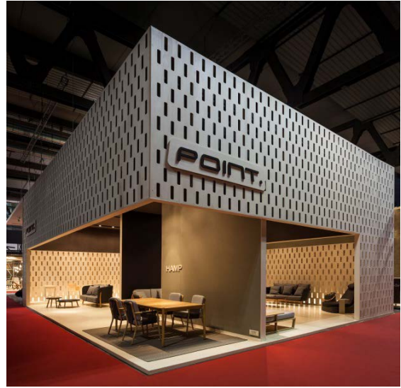
Stand POINT. Il Salone del Mobile, Milano. 2015

España es un país mediterráneo, donde la luz y el clima influyen en la manera en que las personas se relacionan entre ellas y éstas, a su vez, con los objetos, los espacios, la ciudad. Tras tantos años trabajando en este sector ¿crees que podemos hablar de diseño español, de una identidad estética que nos define y diferencia en un mercado cada vez más saturado de productos?