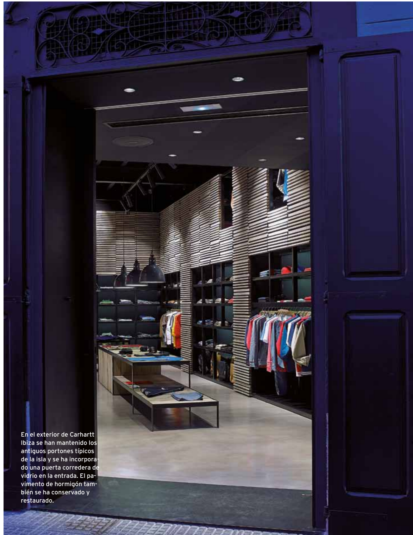
En el exterior de Carhartt Ibiza se han mantenido los antiguos portones típicos de la isla y se ha incorporado una puerta corredera de vidrio en la entrada. El pavimento de hormigón también se ha conservado y restaurado.