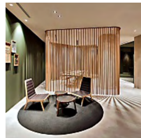
► El empleo de materiales naturales, como la madera, aportan un estilo elegante a los espacios.

“El diseño que practicamos lo compararía con ver a una chica: si te fijas en el interior te debe de dar la sensación de refugio”, finalizó.