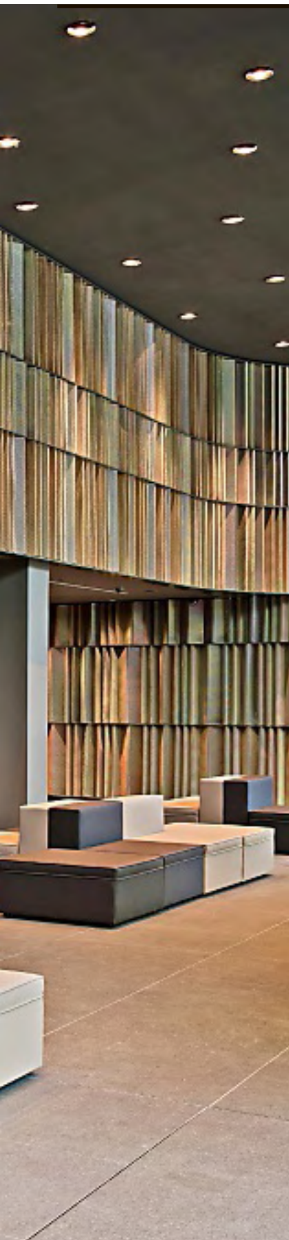
► En el hotel Sana Berlín, el interiorista colocó una malla curva que distingue el lobby.