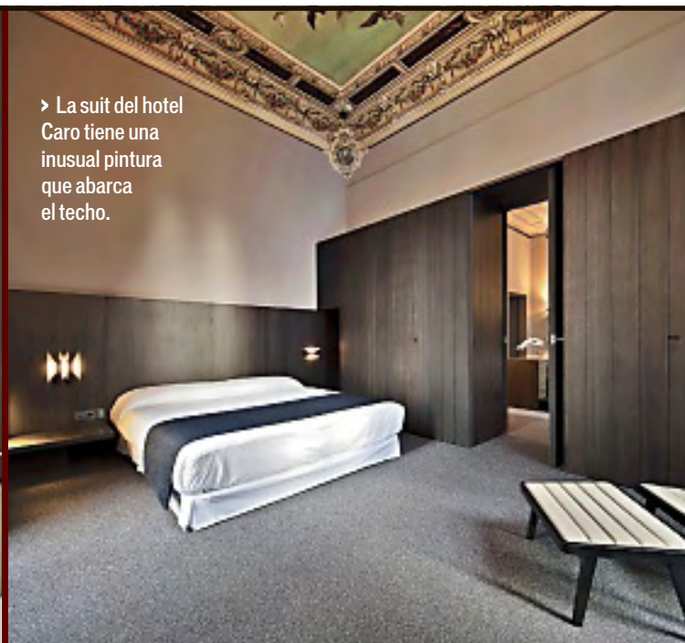
► La suit del hotel Caro tiene una inusual pintura que abarca el techo.