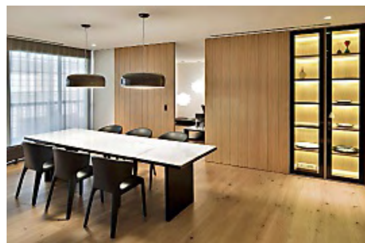
► La oficina del catalán se distingue por el uso de tonos neutros.

el diseñador utilizó como materia prima esencial para la construcción la misma piedra natural que domina el barrio de Girona, y con ella integró los interiores del lugar con la referencia principal del sitio.