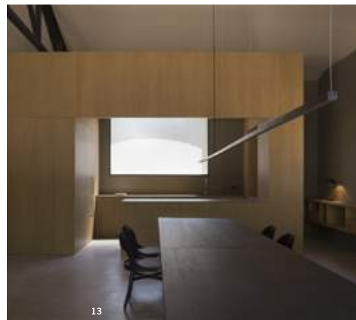
10 y 12/Cocina de Bulthaup, con extractor de encimera de Gaggenau y lámparas diseño del estudio. 11/Salón, presidido por un sofá Aramis de Cármenes. 13 y 14/Un módulo de roble, que integra cocina, baños y un acceso, ordena el espacio reservado a celebraciones.