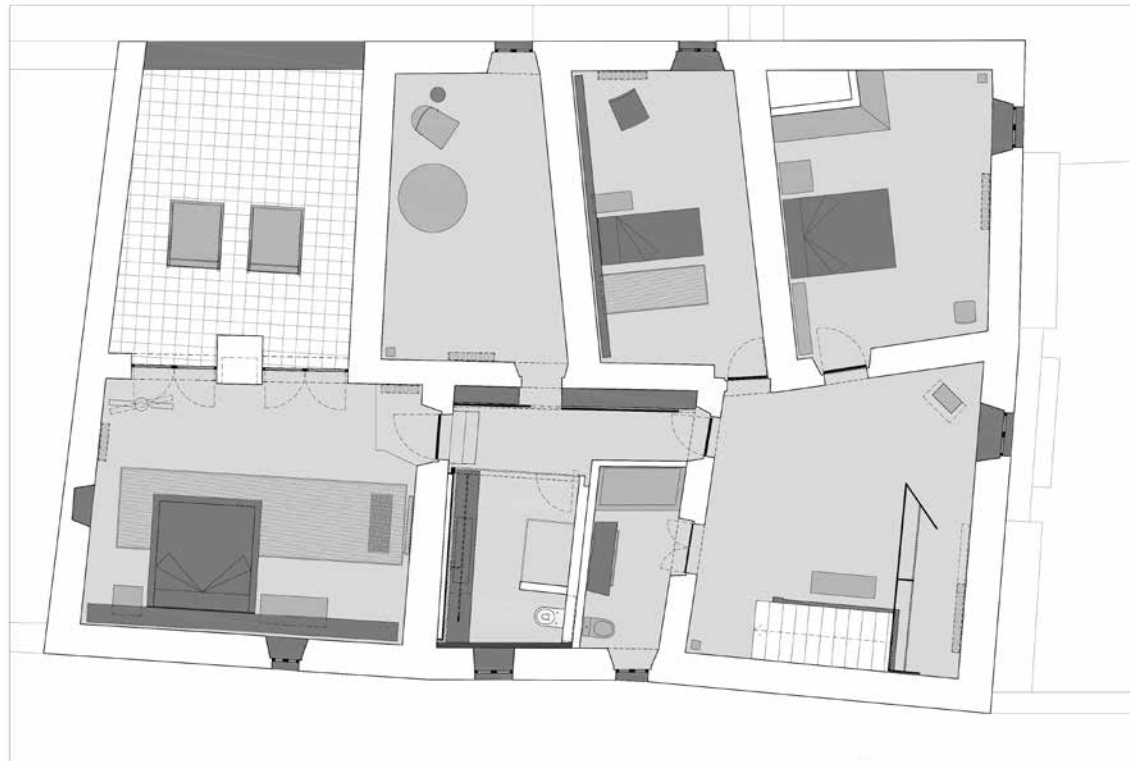
First floor _ Planta primera

On the ground floor of the main building are the reception room/gallery, the kitchen and a number of relaxation or living areas. On the upper floor are two guest bedrooms which are reached via a hallway which also serves the cloakroom/dressing area. The main bedroom is also located on this floor, and is reached via a projected bathroom, in Calacatta marble, which is independent to the building structure. The imposing plated sink is positioned above a mirrored facing. Access to the bathroom is flanked by a dressing room which uses the old wooden doors, and also leads on to a small study.