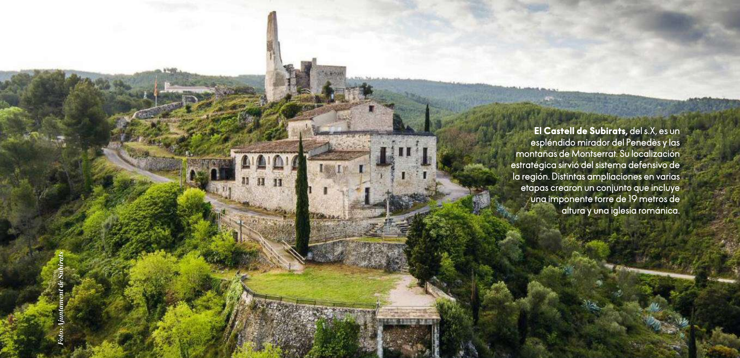
El Castell de Subirats, del s.X, es un espléndido mirador del Penedès y las montañas de Montserrat. Su localización estratégica sirvió del sistema defensivo de la región. Distintas ampliaciones en varias etapas crearon un conjunto que incluye una imponente torre de 19 metros de altura y una iglesia románica.