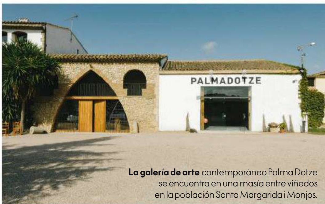
La galería de arte contemporáneo Palma Dotze se encuentra en una masía entre viñedos en la población Santa Margarida i Monjos.

“La fiesta de la Filoxera puede servir como metáfora para la vida, de una plaga que hizo tantísimo daño acabamos organizando la mejor de las fiestas”