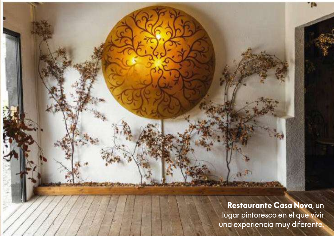
Restaurante Casa Nova , un lugar pintoresco en el que vivir una experiencia muy diferente.

“La fiesta de la Filoxera puede servir como metáfora para la vida, de una plaga que hizo tantísimo daño acabamos organizando la mejor de las fiestas”