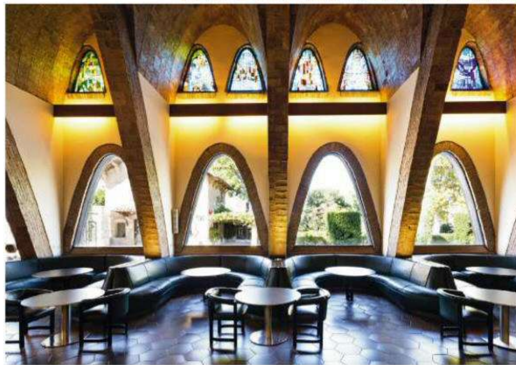
El Hotel Mastinell, un cinco estrellas obra los arquitectos Josep Juanpere y Lluís Escamis (GCA Arquitectes). Sus formas, que nos recuerdan a la manera en la que duermen las botellas de cava, busca sumergir a los visitantes en lo más profundo de la cultura del Penedès. La Sala Puig de Codorníu, informalmente conocida como La Catedral del Cava, se construyó en 1895. Este espacio dedicado a catas y eventos está declarado Monumento Nacional.